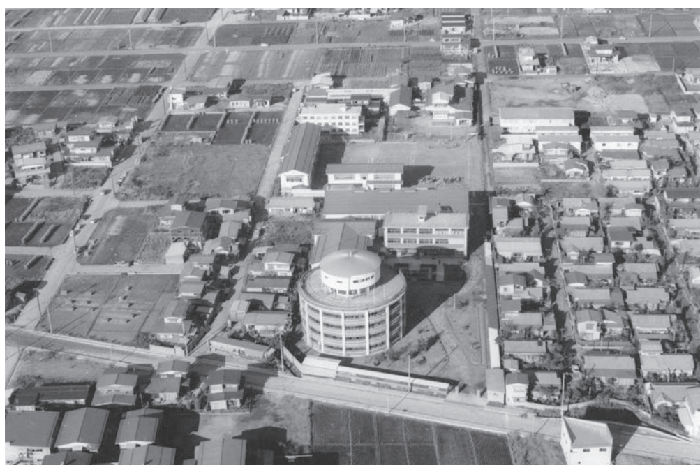
山本学園の全容 (昭和 46 年撮影)