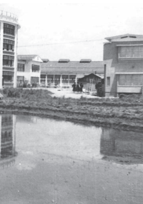
竣工 田園の水面にその姿を映す