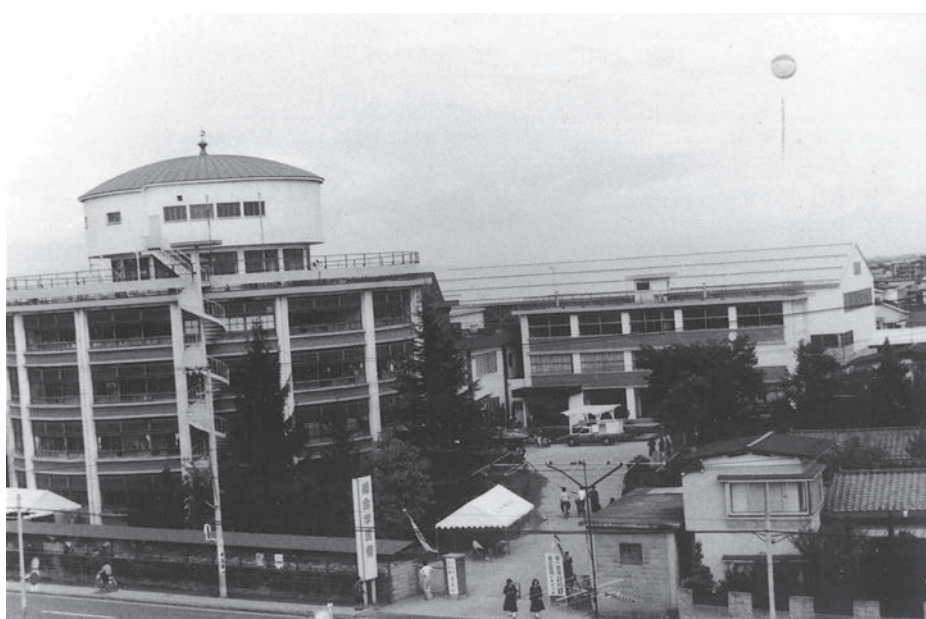
昭和 46 年 創立 50 周年記念「総合学園祭」開催