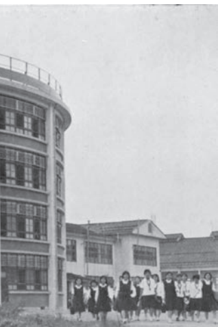
の夏服姿(昭和 40 ~ 43 年)