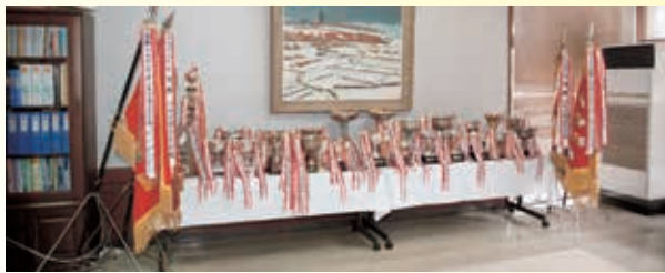
校長室に飾られてある数多くの優勝旗・優勝杯等