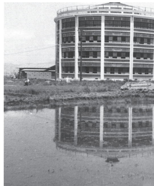
昭和 37 年 東北でも珍しい円型校舎