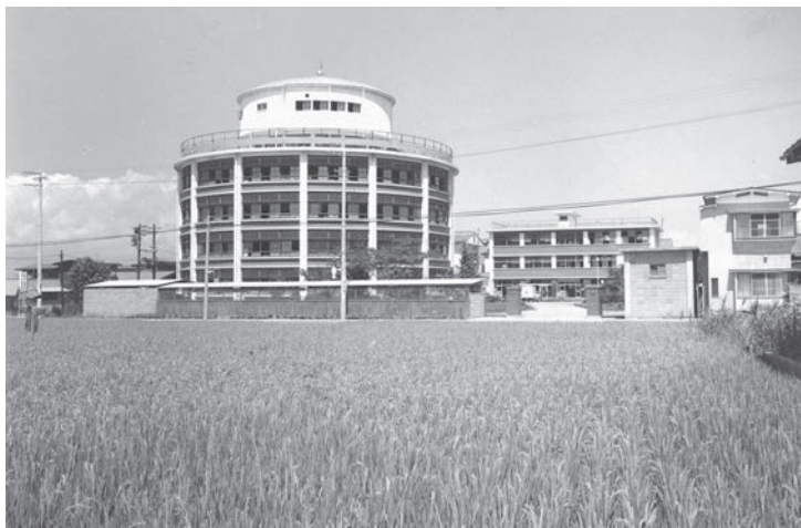
現在とは違い当時はまだ周囲に水田が多かった